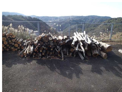
配布予定の伐採木の状況